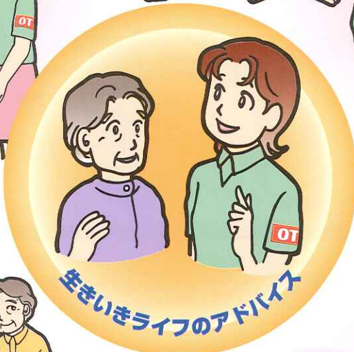
生きいきライフのアドバイス