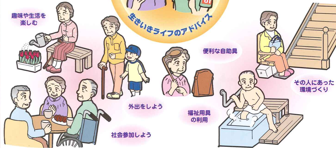
趣味や生活を 楽しむ