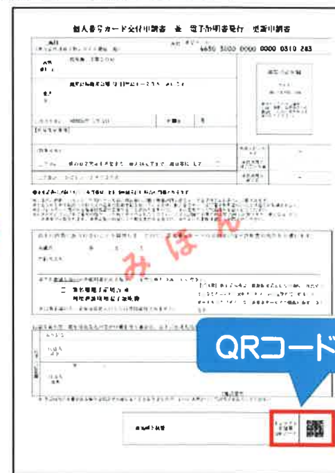
QRコード付き交付申請書